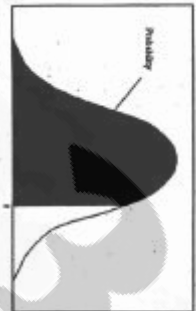
سطح زیر منحنی نرمال استاندارد