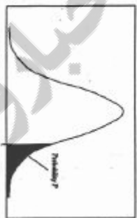
مقادیر بحرانی توزیع t