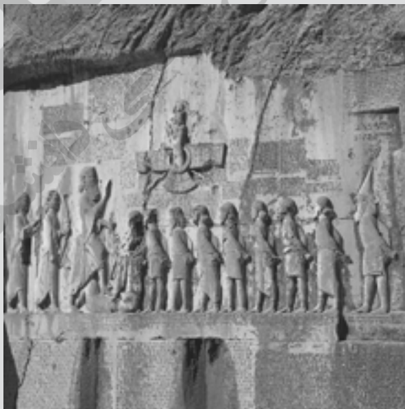
تصویر سنگ نگاره داریوش در بیستون

در سمت چپ نقش برجسته تصویر تمام قد داریوش قرار دارد و دوتن از یاران او پشت سرش ایستاده‌اند. در روبه‌روی او نه تن از سران شورش به بند کشیده به چشم می‌خورند که در جلوی آنها گئومات مغ به پشت خوابیده و پای چپ داریوش بر سینه او نهاده شده است. درست بالای سرشورشیان، نگاره فروهر (نماد اهورامزدا) حک شده است که حلقه‌ای را در دست چپ دارد و به سوی داریوش دراز کرده است. این امر نشان اعطای پادشاهی توسط اهورامزدا به داریوش است.