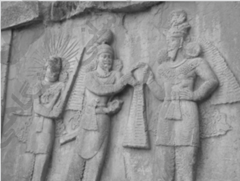
نقش برجسته اهورامزدا و اردشیر دوم ساسانی در طاق بستان

در سمت راست ایوان کوچک طاق بستان، یک سنگ نگاره از اهورامزدا و اردشیر دوم (۳۷۹-۳۸۳ م) نهمین شاه ساسانی وجود دارد. اردشیر با دست راست در حال گرفتن دیهیم شاهی از اهورا مزداست.