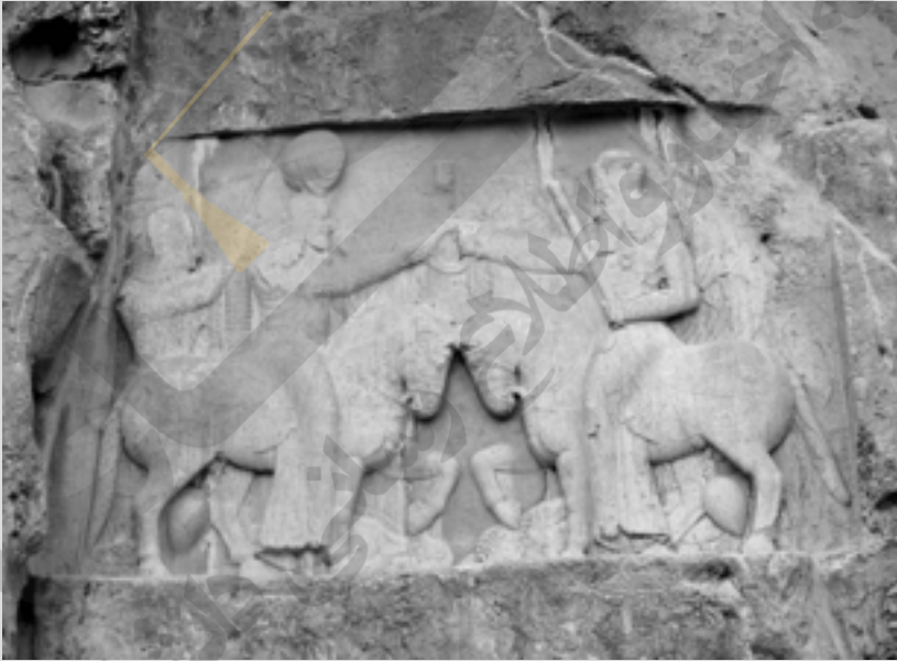
تصویر نقش برجستهٔ اهورا مزدا و اردشیر بابکان در نقش رستم

این سنگ نگاره یکی از سالم‌ترین سنگ نگاره‌های متعلق به دورهٔ ساسانی است. پیکره‌های اردشیر (سمت چپ) و اهورامزدا سوار بر اسب کند و کاری شده‌اند. در زیر پای اسبان، پیکره‌های بر زمین افتادهٔ دشمنان اهورامزدا و شاه یعنی اهریمن و اردوان پنجم اشکانی تصویر شده‌اند. اهورامزدا دست راستش را به سوی اردشیر دراز کرده و دیهیم یا حلقه‌ای از گل را که نماد فره ایزدی است، به او اهدا می‌کند و در دست چپ او برسم ۱ دارد. نقش برجسته‌های دیگری از اهورامزدا و اردشیر با مضمونی شبیه به این. در نقش رجب و فیروز آباد فارس نیز وجود دارد.