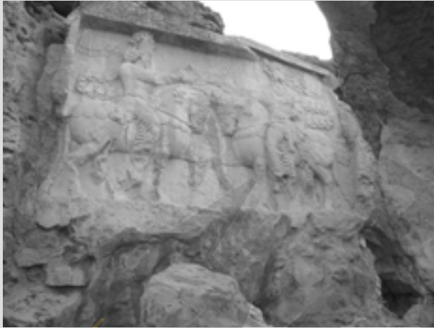
نقش برجسته اهورامزدا و شاپور اول ساسانی در نقش رجب